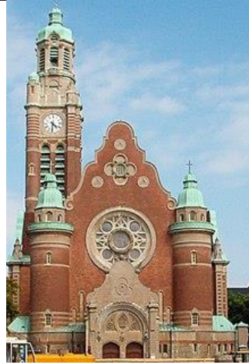
Sankt Johannes Kirke