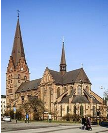
Sankt Petri Kirke