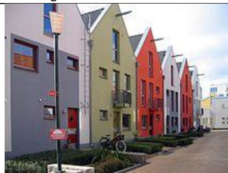
Huse i Västra Hamnen