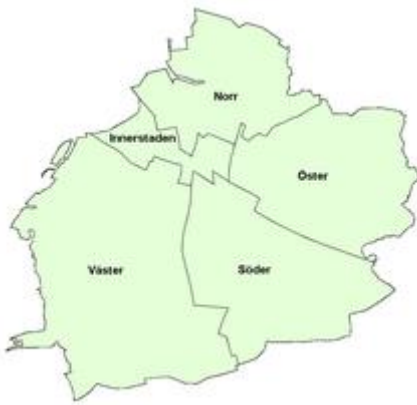
De fem byområder pr. 1. juli 2013 .

Den administrative opdeling af Malmö kommune blev reformeret den 1. juli 2013. De ti byområder, der havde eksisteret siden 1996 blev da slået sammen til fem byområder. Byområderne er igen opdelt i i alt 134 underområder.